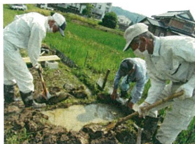
取水口が一番大事