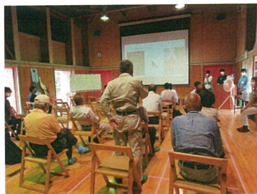
成果発表会では地元の方もご意見を