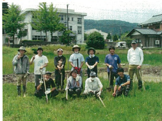
無事にビオトープ3号完成!

部会の出番は、耕作放棄地をビオトープにするために、取水口と排水口の設置や、畔塗りの指導。最終日、「活動成果発表会」にも参加し、人手不足と保全再生とどう向き合っていくかも話題に出しました。エコビレでは今後5年間実習生の受け入れをして、耕作放棄地をビオトープにすることによって、生きものや植生がどう変化していくのか、1年に1回だけですが調査し、データを積み上げていただきます。また、地元の子どもたちによる「坂口エコメイト」と観察会を続け、関わっていきます。