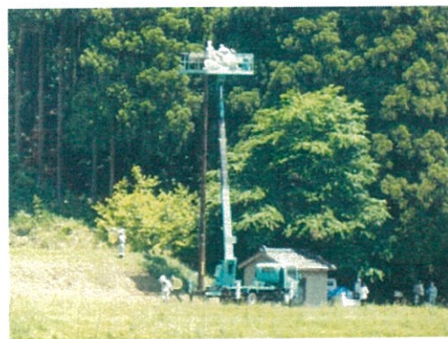
足環装着作業 [5月27日(金)]

オス2羽が巣立ち、「順調だね。」と思われるかもしれませんが、メスが1羽、有害鳥獣対策用電気柵に羽根を絡ませて、ケガをするというアクシデントが発生しています。風切り羽根を数枚やられているので、今年は大空に飛ぶことはもう無理かもしれません。命に別状はないとのことなので、いつの日か大空に飛んでくれることを祈っています。